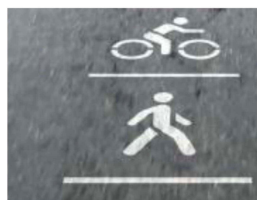
Locatie II - aansluiting fiets- voetpad bij Lageweg